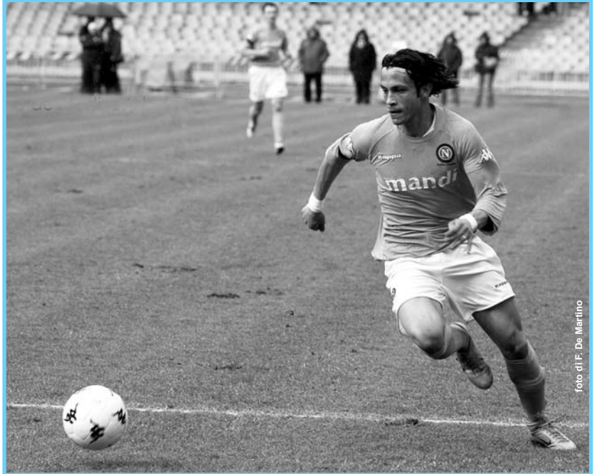
Pià nella stagione 2003/04 con l'Ascoli mise a segno 13 reti